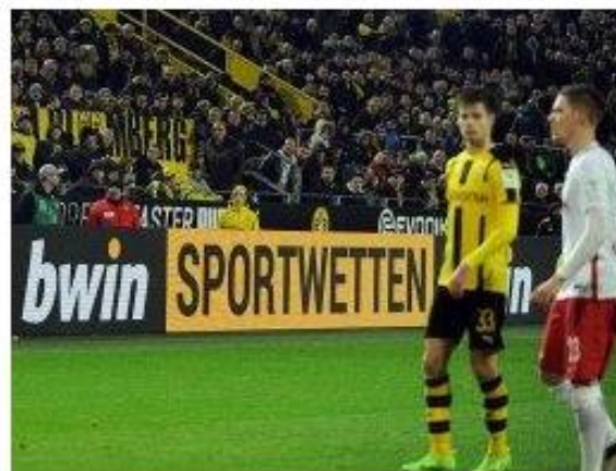
Sportwetten-Anbieter bwin ist künftig Sponsor der 3. Liga,

Saison greift die Partnerschaft dann vollumfänglich. In der Wahl und Exklusivität ihrer eigenen Sponsoren werden die Vereine weiterhin nicht eingeschränkt sein. Dies gilt für die komplette Vertragslaufzeit, bwin fungiert als übergeordneter Liga-Partner.