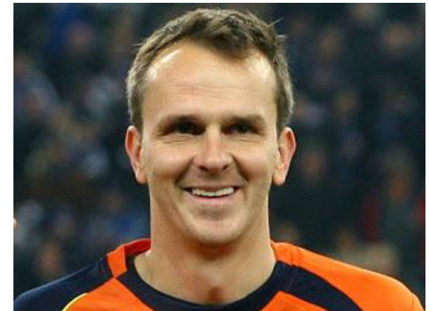
Dietmar „Didi“ Hamann